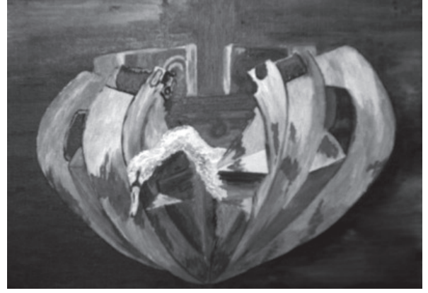
(man), swan and a machine हा हंत हंत नलिनीम् गज उज्जहार।

आधीच्या विचारांच्या त्रुटी लक्षात घेऊन आता विचार